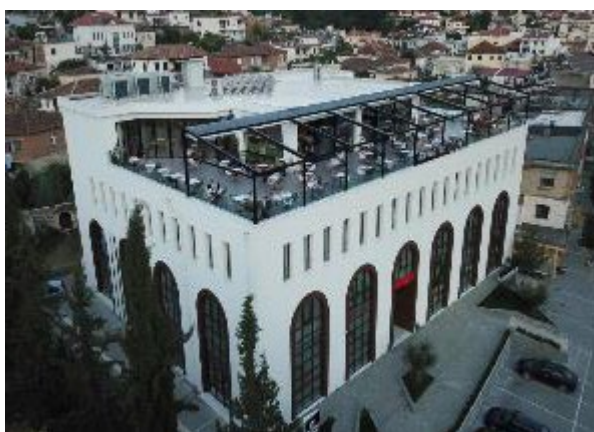
Hotel Portik 4*