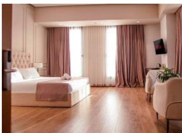
TIRANA Hôtel Metro 4*